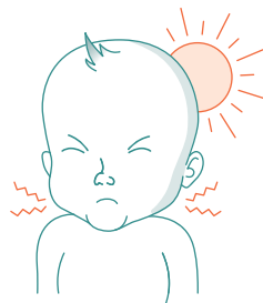
Ukočen vrat, osetljivost na svetlost 2

Ove ilustracije Vam mogu pomoći da prepoznate ČESTE znakove i simptome meningitisa i sepse kod odojčadi i dece.