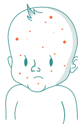
Bleda, prošarana koža; tačkice/osip 2

NE ČEKAJTE POJAVU OSIPA, JER SE ON NE MORA POJAVITI. 2,3 AKO SE POJAVI BILO KOJI OD OVIH ZNAKOVA ILI SIMPTOMA, ODMAH POTRAŽITE POMOĆ LEKARA.