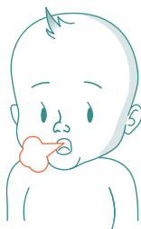
Ubrzano disanje ili stenjanje pri disanju 2