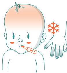
Povišena telesna temperatura, hladne šake i stopala 2

Vaše dete prima lek ULTOMIRIS®, koji umanjuje prirodnu odbranu organizma od meningitisa i sepse. Meningitis i sepsa su IZUZETNO OPASNE infekcije i mogu brzo postati OPASNE PO ŽIVOT .